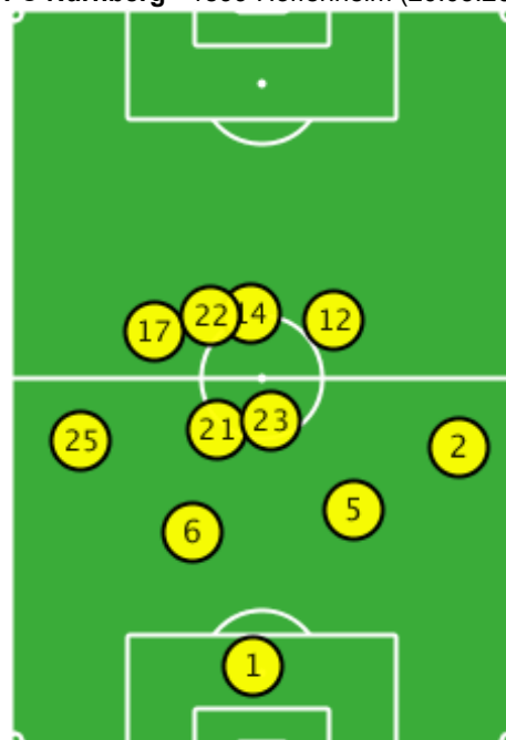
1. FC Nürnberg - 1899 Hoffenheim (20.03.2010)