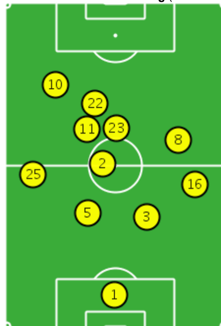
Eintracht Trier - 1. FC Nürnberg (15.08.2010)