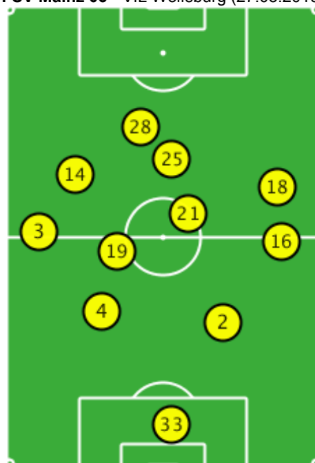
FSV Mainz 05 - VfL Wolfsburg (27.03.2010)