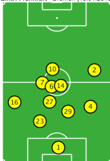
Eintr. Frankfurt - Bremen (16.01.2010)

1 Nikolov, 2 Ochs, 4 Franz, 6 Teber, 7 Köhler, 10 Liberopoulos, 14 Meier, 16 Spycher, 23 Russ, 27 Schwegler, 29 Chris